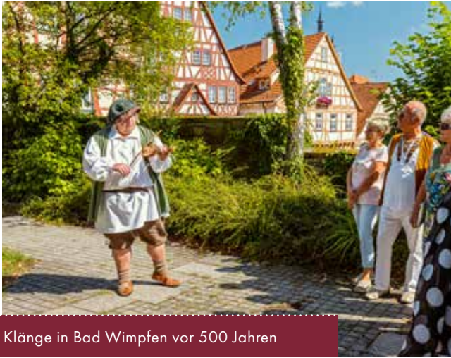
Klänge in Bad Wimpfen vor 500 Jahren