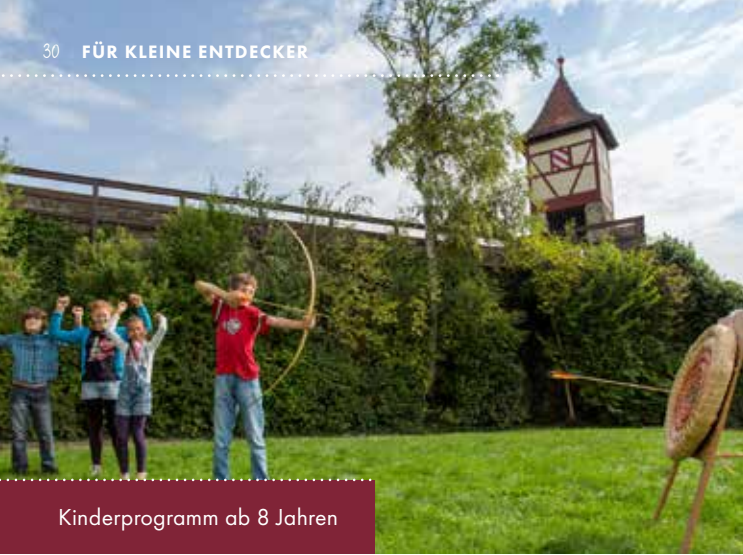
Kinderprogramm ab 8 Jahren