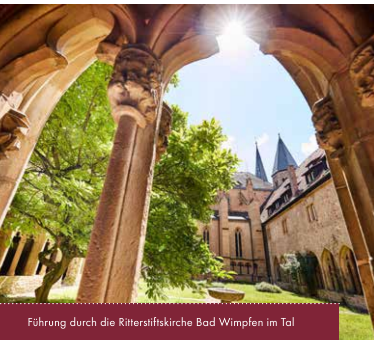
Führung durch die Ritterstiftskirche Bad Wimpfen im Tal