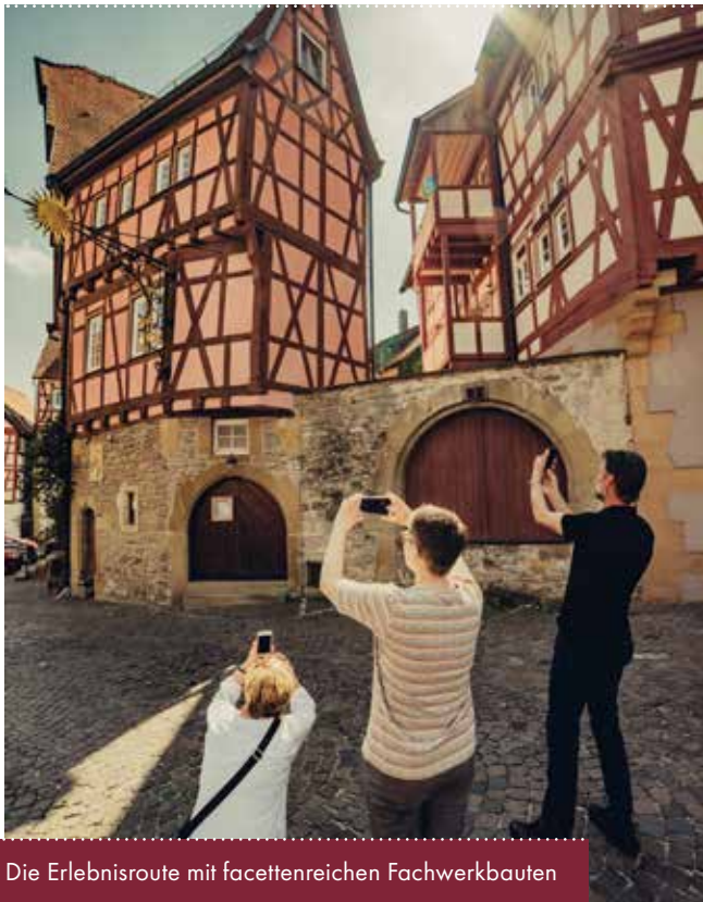
Die Erlebnisroute mit facettenreichen Fachwerkbauten