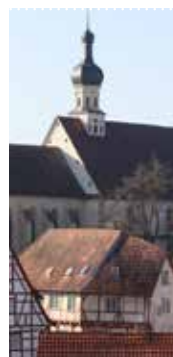
Katholische Heilig Kreuz Kirche

Die Kirche ist nur für Sonderveranstaltungen geöffnet.