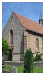
Cornelienkirche Bad Wimpfen im Tal

Änderungen vorbehalten – Hinweise auf der Internetseite www.kirche-badwimpfen.de .