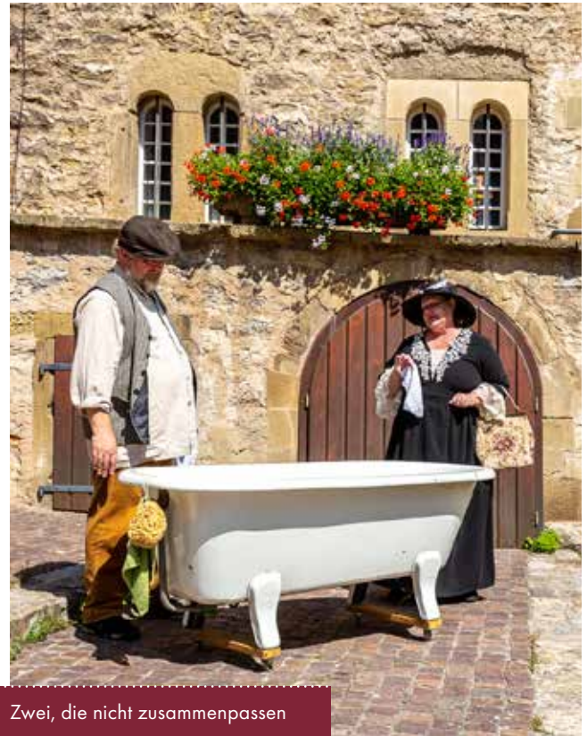
Zwei, die nicht zusammenpassen