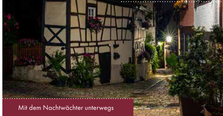
Mit dem Nachtwächter unterwegs

Öffentlicher Termin: 08. September 2024 | 14.00 Uhr ab Altes Spital/Hof | Preis pro Person 8,00 €