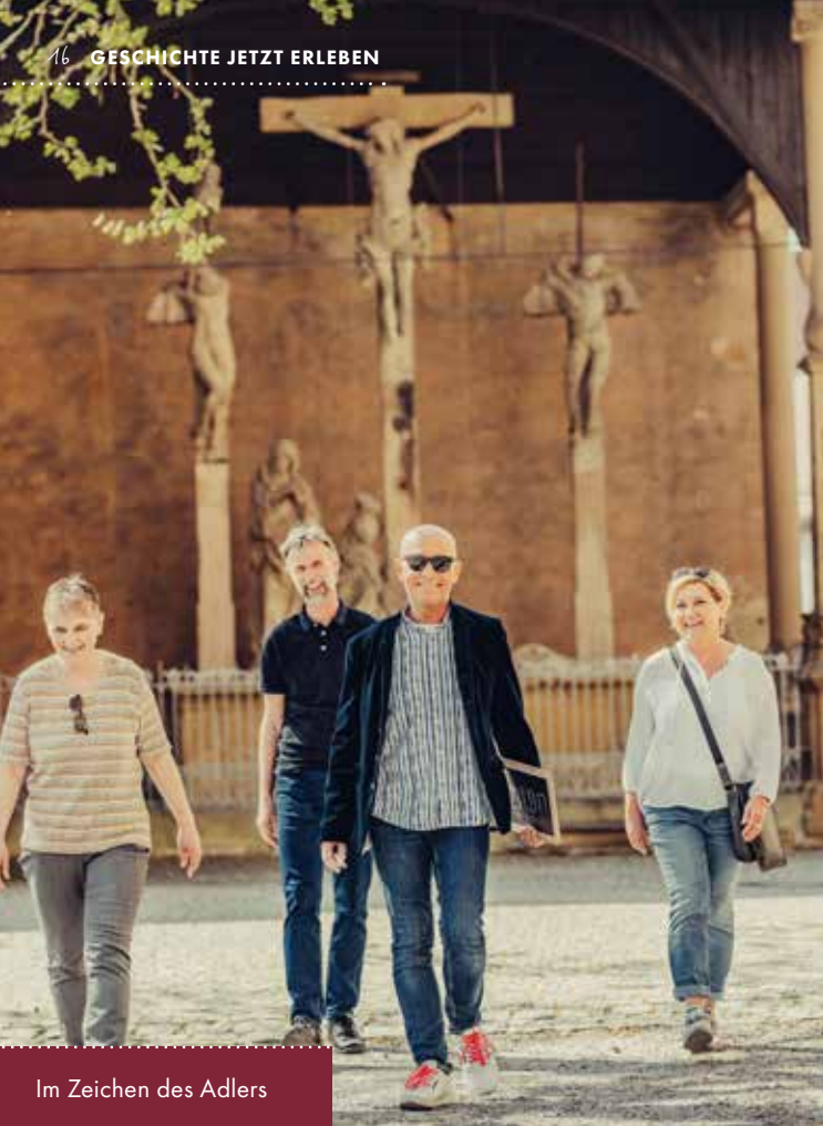
Im Zeichen des Adlers