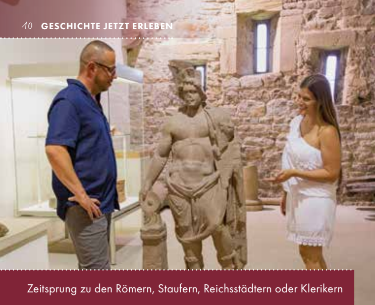
Zeitsprung zu den Römern, Staufern, Reichsstädtern oder Klerikern