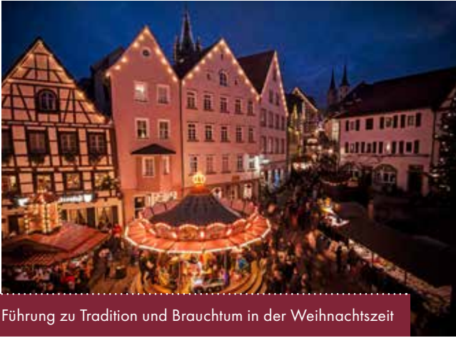
Führung zu Tradition und Brauchtum in der Weihnachtszeit