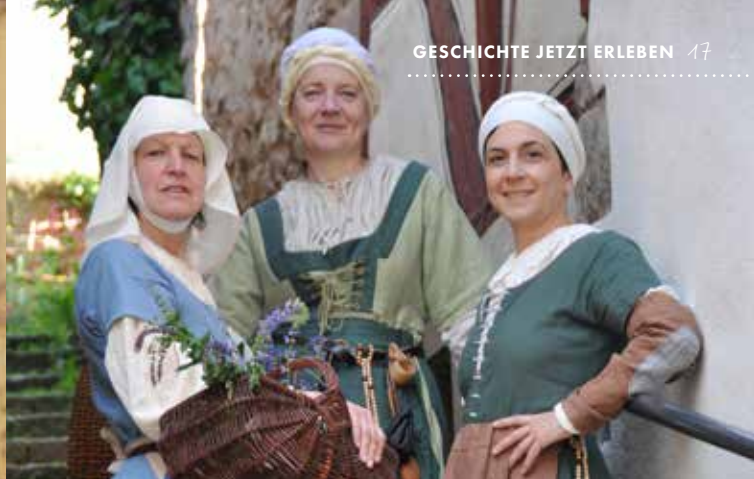
Führungen mit den Wimpfener Weybern