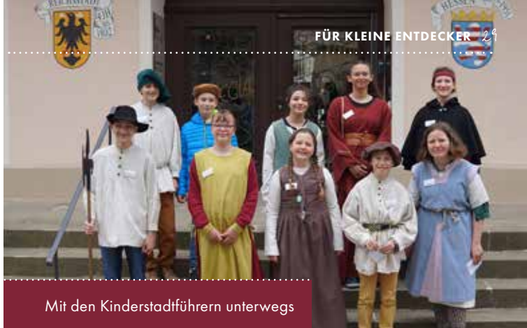
Mit den Kinderstadtführern unterwegs

Auf Anfrage auch für Firmen als Mitarbeiteranlässe mit parallelen Gruppen im Wechsel buchbar.